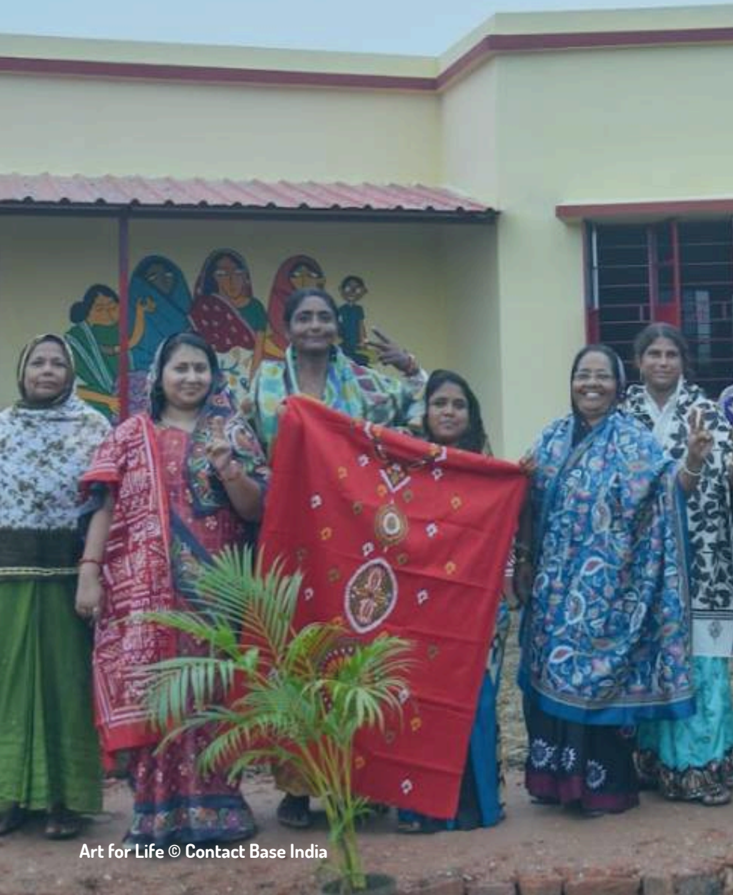
Art for Life