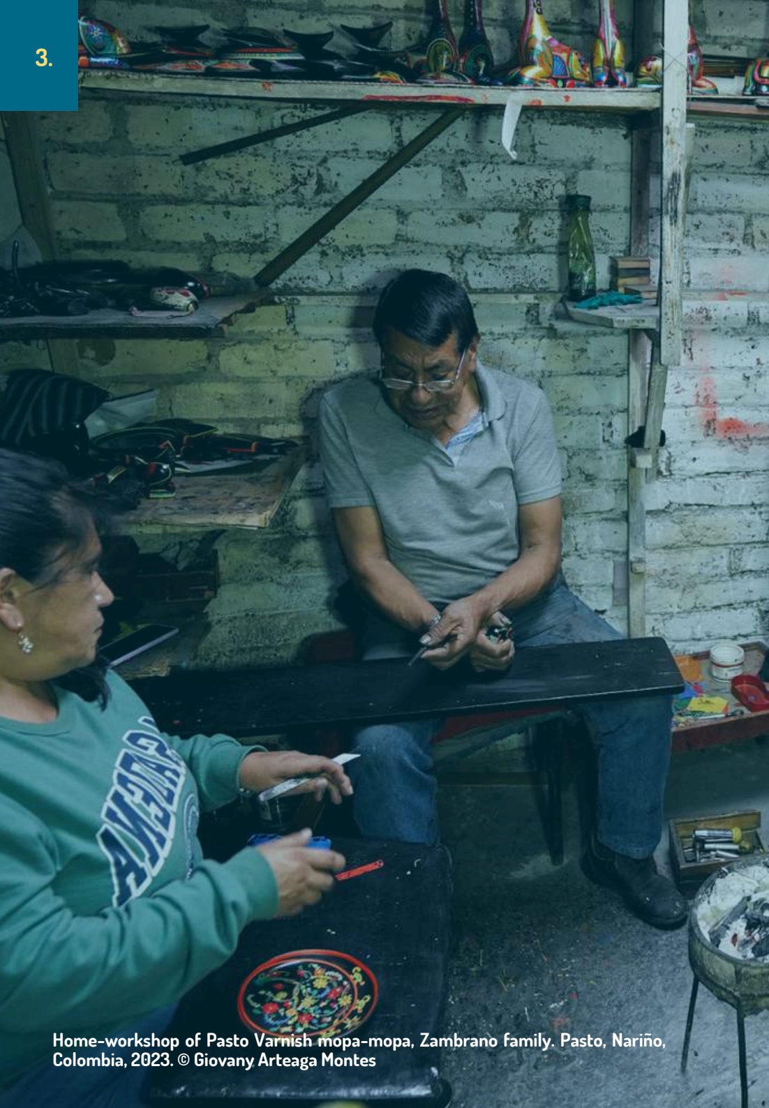
Home-workshop of Pasto Varnish mopa-mopa, Zambrano family. Pasto, Nariño, Colombia, 2023.